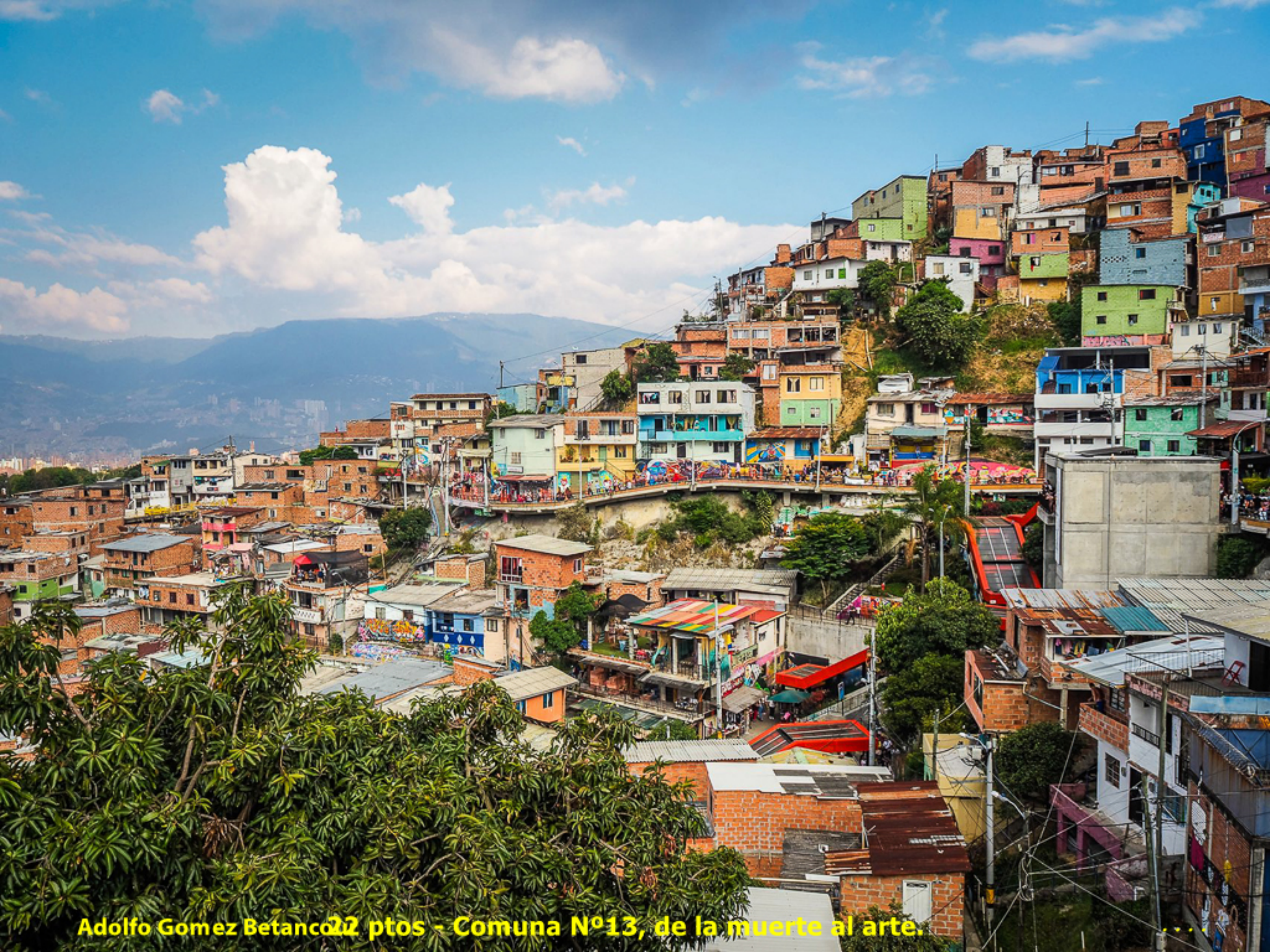
Adolfo Gomez Betanco 22 ptos - Comuna N°13, de la muerte al arte.