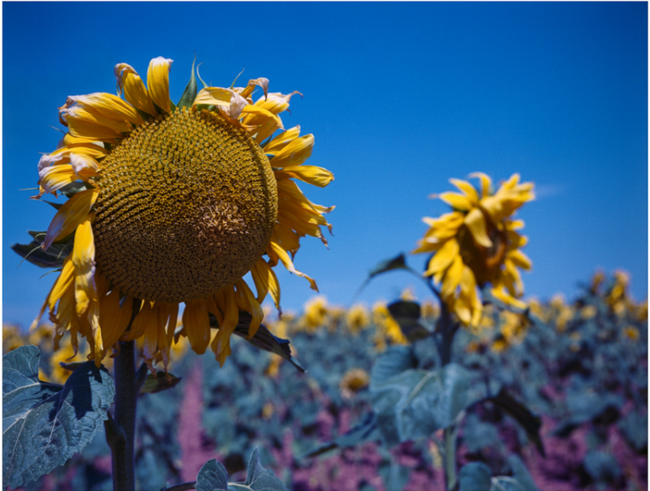
Campos de Palencia